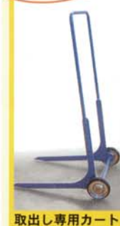
取出し専用カート