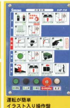
運転が簡単 イラスト入り操作盤